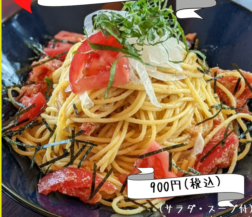
トマトと大葉のあっさりパスタ