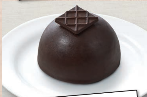
5 ドームチョコ 650円