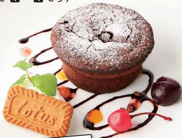
2 フォンダンショコラ 650円