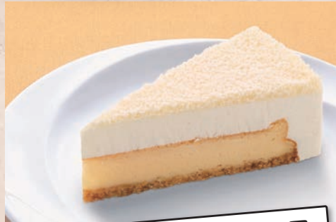
7 北海道チーズの2層 ケーキ 650円