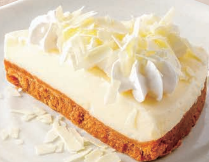
3 レアチーズケーキ 650円