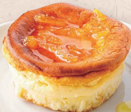
4 スフレチーズケーキ 650円