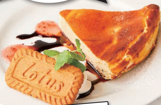
1 ベイクドヨーグルト ケーキ 650円