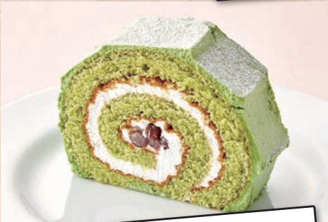
6 抹茶のロールケーキ 650円